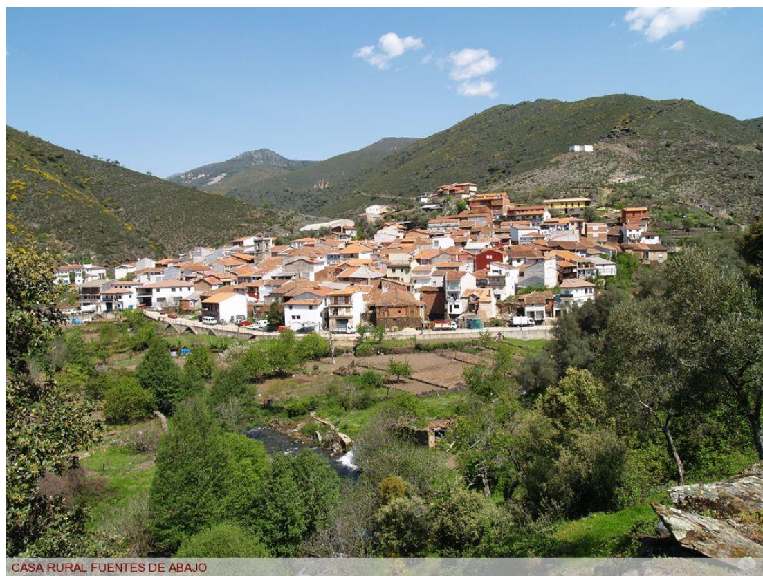
CASA RURAL FUENTES DE ABAJO

* Este sencillo artículo es un humilde pero sentido homenaje a cuantos hombres y mujeres han habitado estas tierras, han trabajado como nadie y han legado un patrimonio que poco a poco se oculta a los ojos. Es el reconocimiento hacia tantos y tantos anónimos artífices que no tienen nombre en la historia pero la hicieron domesticando el paisaje y en el ir y el venir del camino.